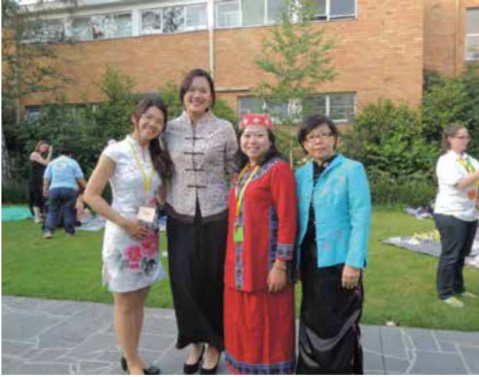
2013 韓國國際露營 第 11 屆亞太會議 - 日本東京 2014 第 35 屆世界會議 - 香港 亞太地區服務員研討會 - 澳洲