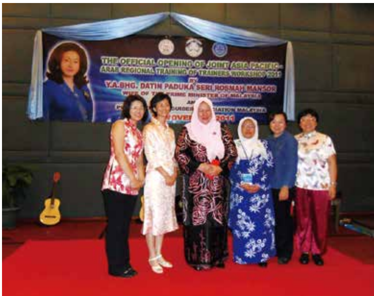
2011 韓國第 13 屆女童軍大露營 第 34 屆世界會議 - 蘇格蘭 馬來西亞訓練專員研習營