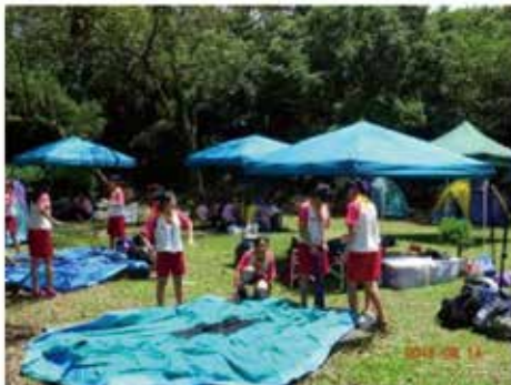
女童軍們在龍門營地展開為期四天的大露營

14日上午，女童軍們由各地搭乘火車、遊覽車陸續抵達營地報到、領取器材，隨後動手搭建帳篷、練習節目表演等，下午將開始正式進行模組活動，預定於晚上舉行開幕典禮，營地中充滿青春與活力的氣息。