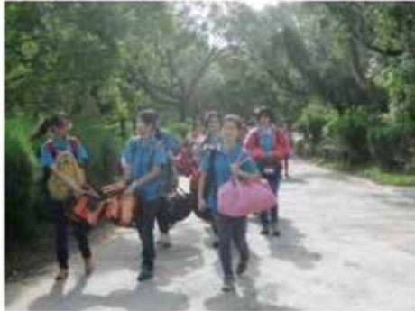
來自台灣各縣市及日本、韓國、香港等地的女童軍抵達營地參加大露營

「中華民國台灣女童軍第8次全國大露營」於8月14日至17日假新北市龍門露營場舉行，本次共有來自台灣各縣市及日本、韓國、香港等女童軍代表團1000餘人參加。女童軍們將在營地露營並進行交流與學習，活動包括地球發展村、臥虎藏龍(獨木舟體驗)、童軍魔法學院、福隆旅行公司()、Free Being Me五大模組活動，夜晚還有開幕典禮、國際之夜、營火等。