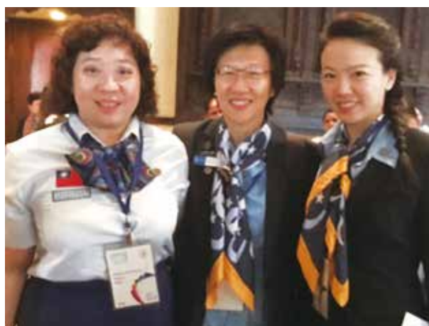
2016 韓國慶州女童軍大露營 香港女童軍百年童創新紀元國際大露營 第 12 屆亞太會議 - 尼泊爾