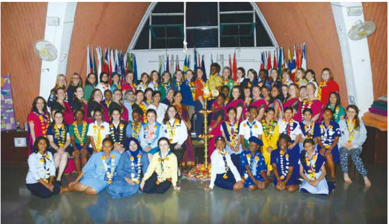
2015 萊麗特蘿研討會 - 印度