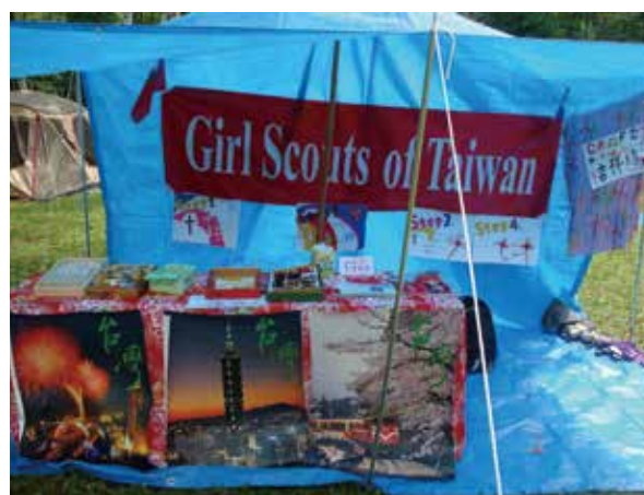
2012 日本彩之國女童軍國際大露營 世界青年婦女論壇 海倫史都華研討會