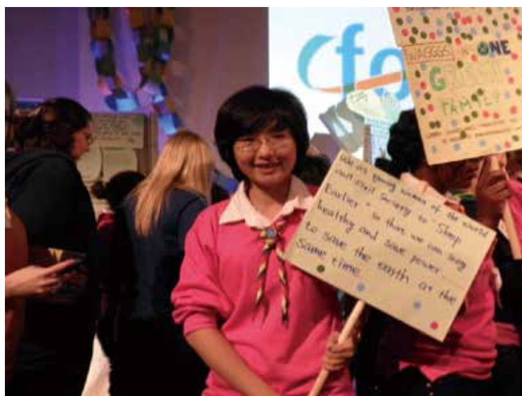
2010 英國女童軍百週年露營 日本女童軍 90 週年露營 世界青年論壇 YWWF 澳洲 ACE 大露營 第 11 屆亞太會議 - 馬爾地夫