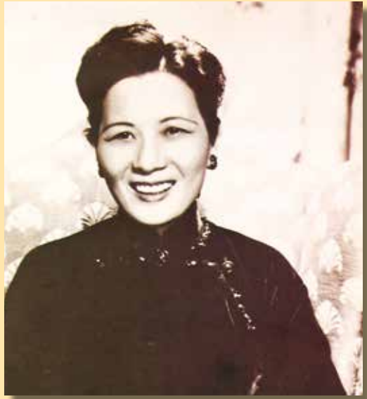
中華民國女童軍總會名譽會長 蔣宋美齡 女士