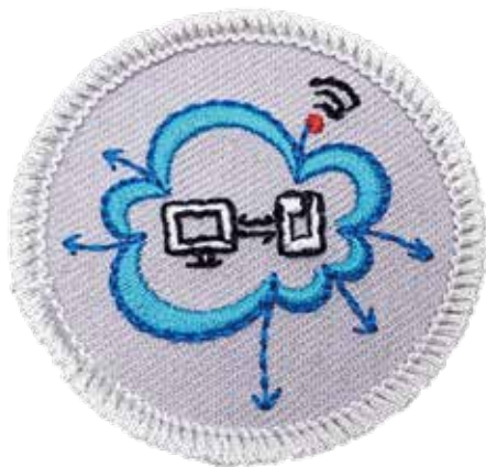
★數位時代女童軍活動布章

★數位時代女童軍活動方案：種子教師在培訓過後，可以回到團內實施數位時代女童軍的活動方案，讓女童軍在有趣的活動中學習數位時代的課題。此方案也在組訓委員會討論通過，成為女童軍進程中的新議題。