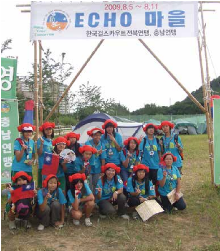
2009 Our Chalet Rover Week- 瑞士 比利時 Flamboree 國際大露營 韓國第 12 屆女童軍大露營