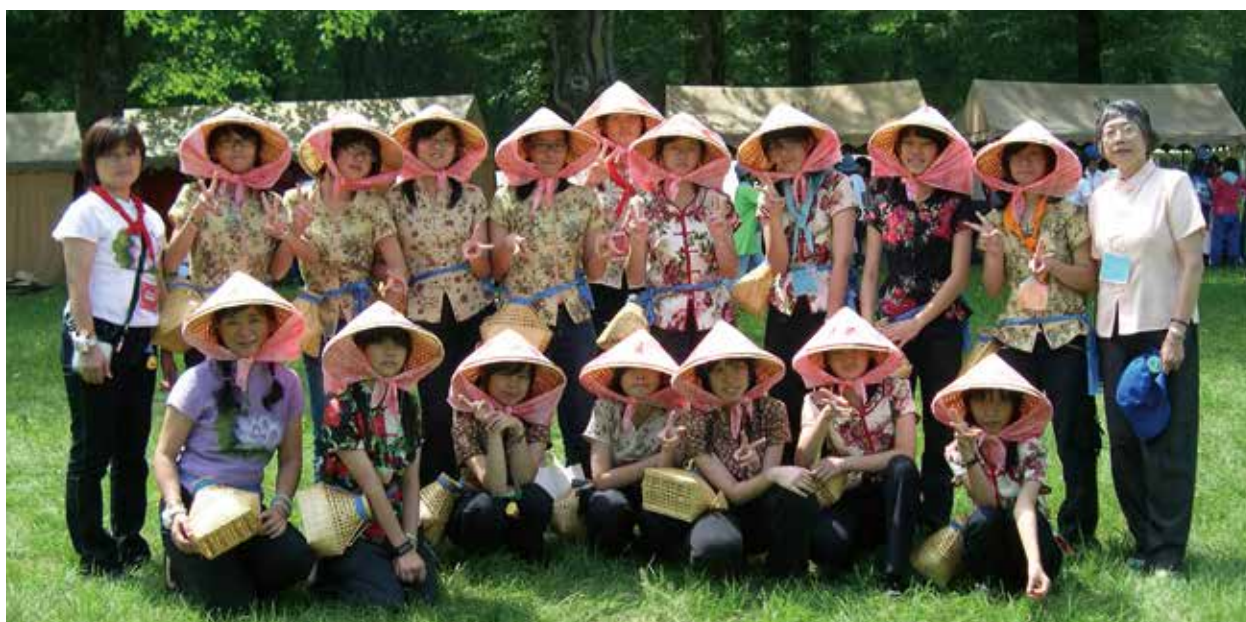
2008 世界女童軍總會第 33 屆會議 - 南非約翰尼斯堡 Our Chalet Rover Week- 瑞士 日本彩之國女童軍國際大露營 - 日本長野縣