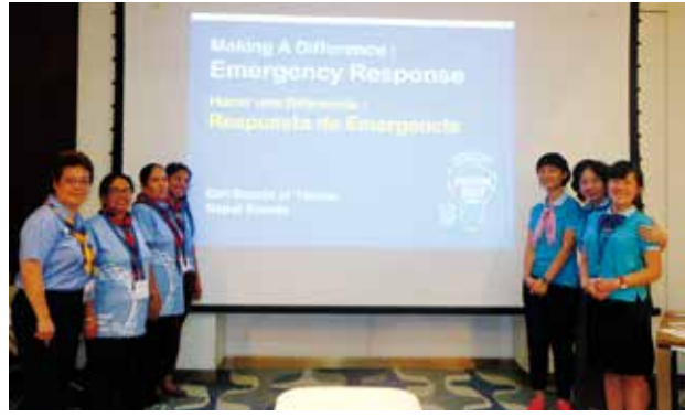
2017 英國 Ayrwaves 露營 第 36 屆世界會議 - 印度 韓國女童軍露營 - 光州 ARTS 4 CHANGE—印度桑剛